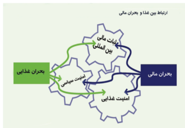
شکل شماره ۲. ارتباط بحران مالی با بحران غذایی

یکی از عمده‌ترین عواملی که همواره قیمت مواد غذایی را تحت تأثیر قرار داده است، مسئله احتکار بوده است. با بروز بحران مالی ایالات متحده در سال ۲۰۰۸، بسیاری از کسانی که سرمایه‌های خود را در بازار مسکن یا بازارهای دیگر سرمایه‌گذاری کرده بودند، آن را روانه بازارهای مواد خام نمودند. احتکار به معنی فرض ریسک از دست دادن سرمایه در عوض احتمال نامطمئن سود است. به طور عامیانه تعریف احتکار خرید کالا برای فروش و آزادسازی در آینده به جای مصرف در زمان کنونی است. احتکار کالا شامل خرید، نگهداری، فروش و خرید موقت سهام، اوراق بهادار، مواد خام یا هر ابزار مالی ارزشمند برای سود بردن از نوسانات قیمت آن در برابر خرید به قصد مصرف است. در چهارچوب بازار مواد غذایی، محتکران کسانی هستند که متحمل ریسک نسبی می‌شوند. احتکار مواد غذایی به عنوان یکی از عوامل مؤثر بر افزایش قیمت، نیاز به تنظیمات خاصی در سطح مؤسسات جهانی دارد که تا به حال مفقود بوده است. راه حلی جهانی برای جلوگیری از احتکارات بیشتر دربردارنده هزینه‌های بسیاری است، اما در مقایسه با زیان‌های افزایش قیمت نظیر آنچه در سال ۲۰۰۸-۲۰۰۷ اتفاق افتاد هنوز این سیاست بازدهی بیشتری خواهد داشت. (۱۲) نمودار ذیل ارتباط بحران غذایی را با بحران مالی اخیر نشان می‌دهد.